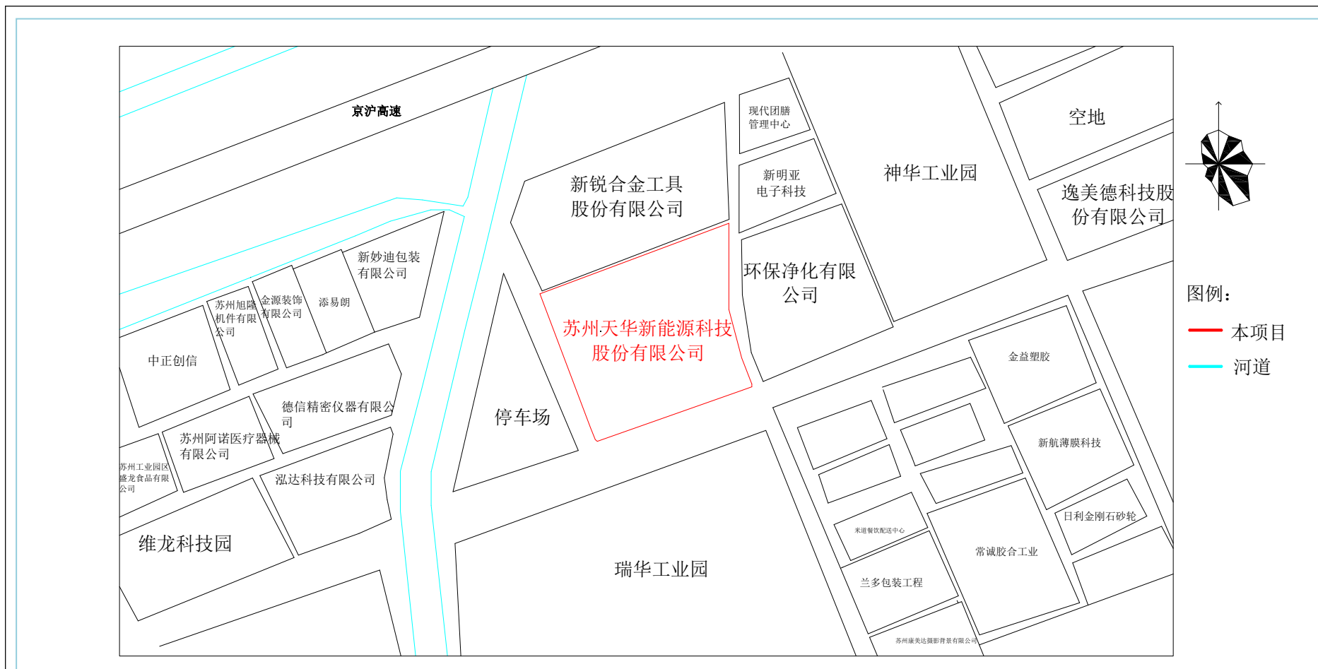
附图 2 项目周围环境状况图